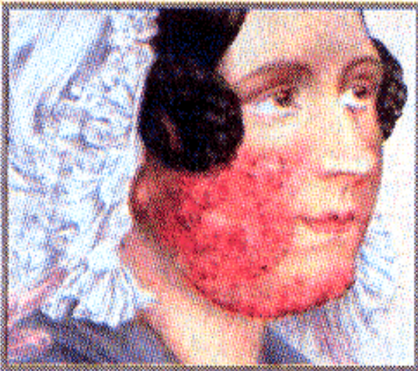
Lupus vulgaris hypertrophicus