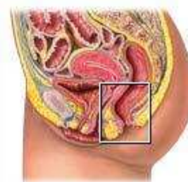
Wasir yg mengalami peradangan